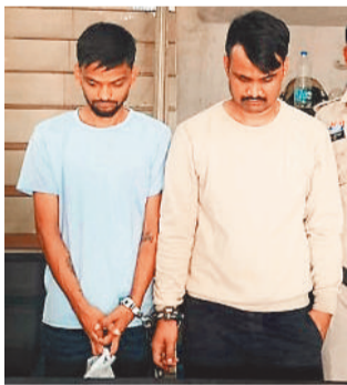
पुलिस की गिरफ्त में आरोपी।