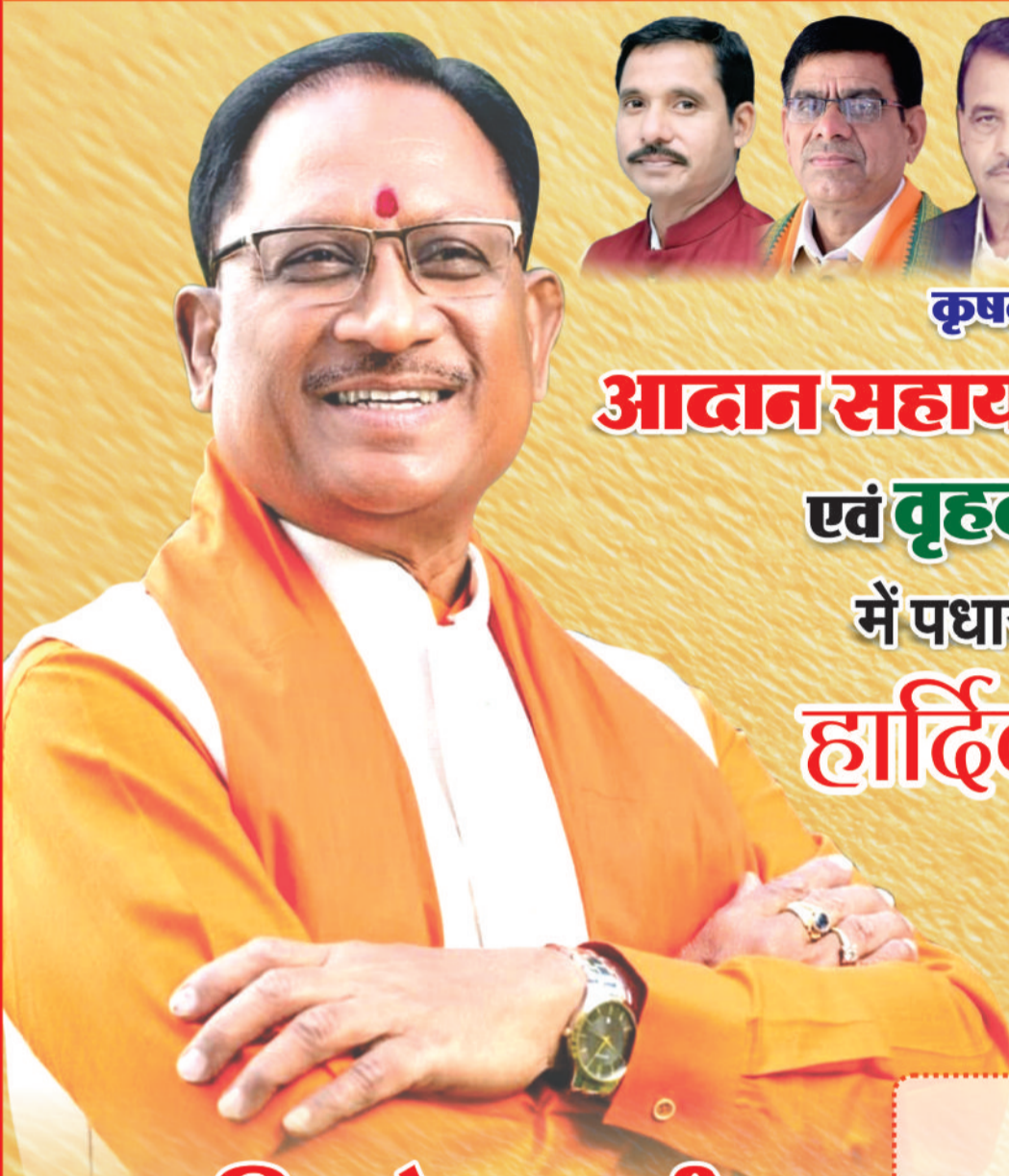
मा. विष्णुदेव साय जी मुख्यमंत्री छ.ग. शासन