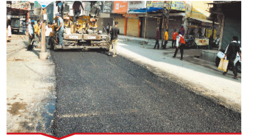
जून बिलासपुर सड़क पर डामरीकरण शुरू हो गया।

[बिल्हा | मस्तूरी | तखतपुर | मुंगेली | कोटा | लोरमी | सरगांव | पेंड़ा | बेलतरा | रतनपुर | पथरिया]